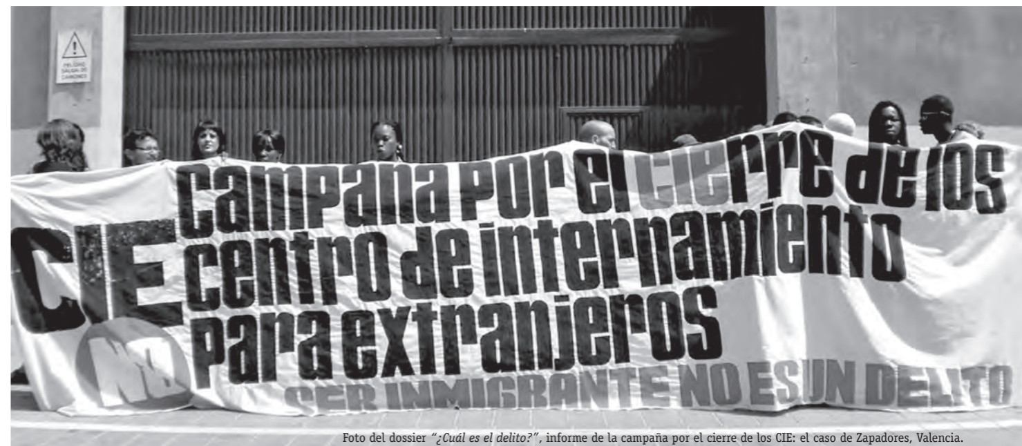
Foto del dossier “¿Cuál es el delito?”, informe de la campaña por el cierre de los CIE: el caso de Zapadores, Valencia.